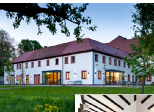
Ehemaliges Kapuziner- kloster Aschaffen- burg

Neben klassischen Wohnungsbauprojekten hat sich die SBW besonders auf Sozial- und Verwaltungsbauten spezialisiert. Die Wurzeln des Unternehmens liegen im Bistum Würzburg; viele Auftraggeber stammen bis heute aus dem kirchlichen und kommunalen Bereich. Beispiele dafür sind der Umbau und die Umnutzung ehemaliger Klostergebäude für die Katholisch-Theologische Fakultät der Julius-Maximilians-Universität Würzburg sowie die Sanierung des ehemaligen Kapuzinerklosters in Aschaffenburg.